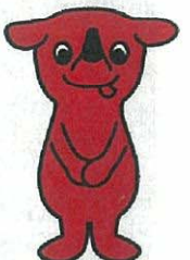
千葉県マスコットキャラクター 「チーバくん」